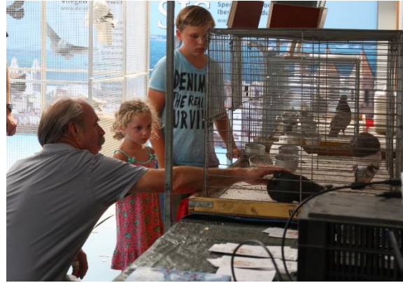
Veel kinderen bij de stand en ze vonden de duiven prachtig!