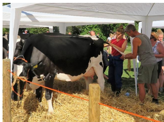
De dieren moeten wel schoon zijn.